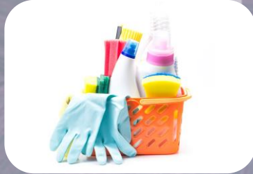
NOM-189-SSA1/SCFI-2018 Etiquetado productos de aseo de uso doméstico