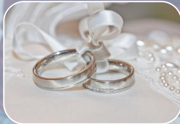
NOM-033-SCFI-1994 Alhajas o artículos de oro, plata