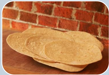
NOM-187-SSA1/SCFI-2002 Etiquetado de masa y tortillas