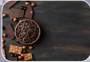
NOM-186-SSA1/SCFI-2013 Etiquetado cacao, chocolate y productos similares