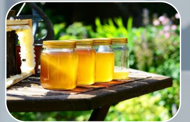
NOM-145-SCFI-2001 Etiquetado de miel