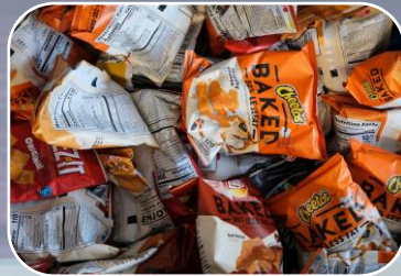
NOM-051-SCFI/SSA1-2010 Etiquetado para alimentos y bebidas no alcohólicas