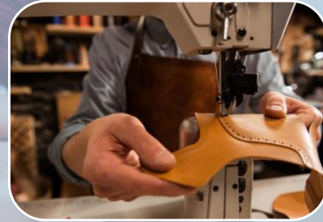
NOM-020-SCFI-1997 Etiquetado de cueros y pieles curtidas