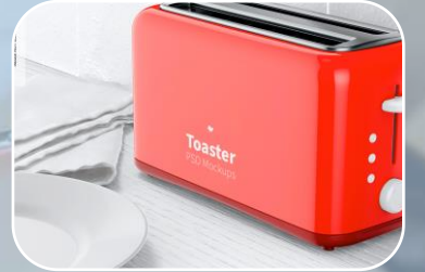
NOM-024-SCFI-2013 Etiquetado de productos electrónicos, eléctricos y electrodomésticos