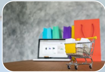
NOM-050-SCFI-2004 Etiquetado general de productos