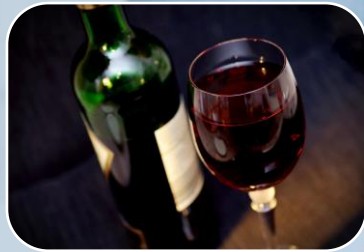
NOM-142-SSA1/SCFI-2014 Etiquetado de bebidas alcohólicas.