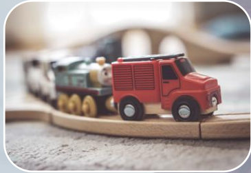
NOM-015-SCFI-2007 Etiquetado para juguetes