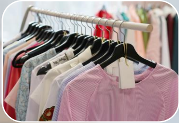
NOM-004-SCFI-2006 Etiquetado de productos textiles