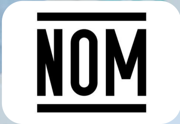
NOM-003-SCFI-2014 , Productos eléctricos-Especificaciones de seguridad